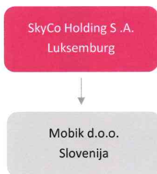
Slika 1: Lastniška struktura skupine v Sloveniji.

Družba Mobik d.o.o. nima odvisnih družb.