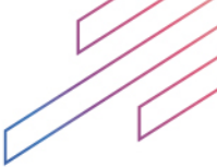
TABLEAU DES FLUX DE TRÉSORERIE POUR LES EXERCICES CLOS LES 31 DÉCEMBRE 2023 ET 2024